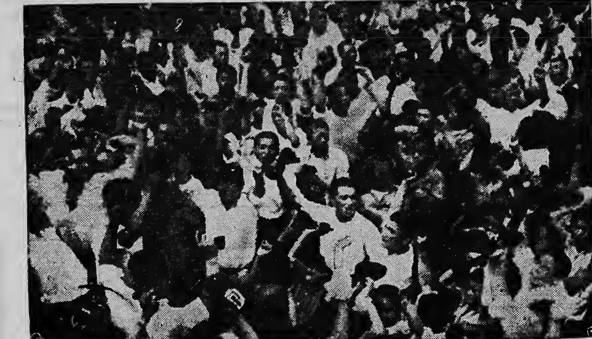
HET HOTEL WAAR DE BUITENLANDSE correspondenten in Seoul wonen is een van de centra waar rond omheen vrijwel dagelijks wordt gedemonstreerd. Hierboven een foto van enkele honderden studenten, die protesteren tegen de voorgenomen bestandsovereenkomst. President Rhee heeft de demonstranten gewaarschuwd, dat lijke vijandelijke daad tegen de Verenigde Naties zeer ernstig zal worden gestraft.